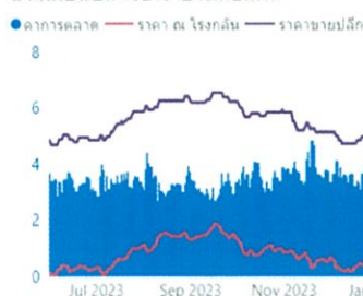
น้ำมันเบนซิน 95E10 (บาทต่อลิตร)